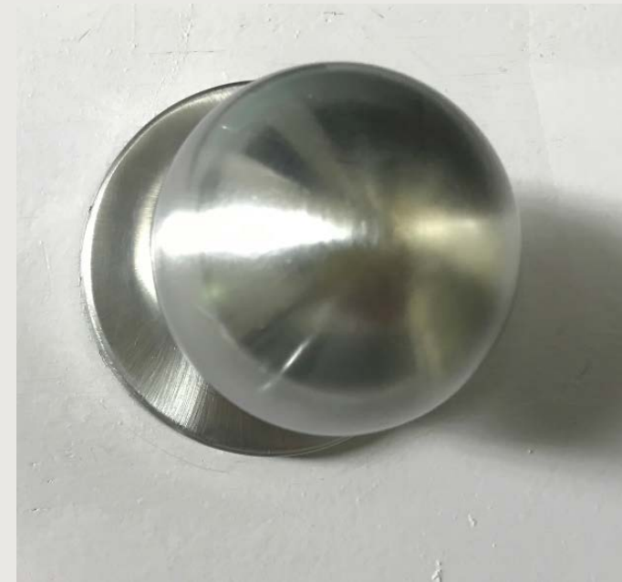
숙실 내부 손잡이