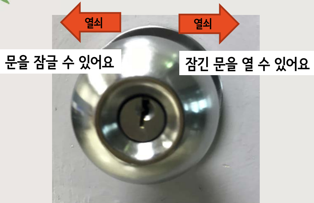
숙실 외부 손잡이